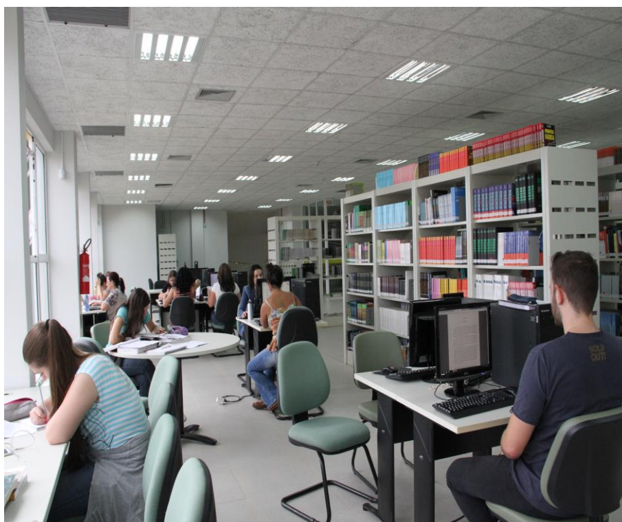
Figura 1 - Biblioteca

As figuras devem ser apresentadas conforme exemplo da Figura 1: